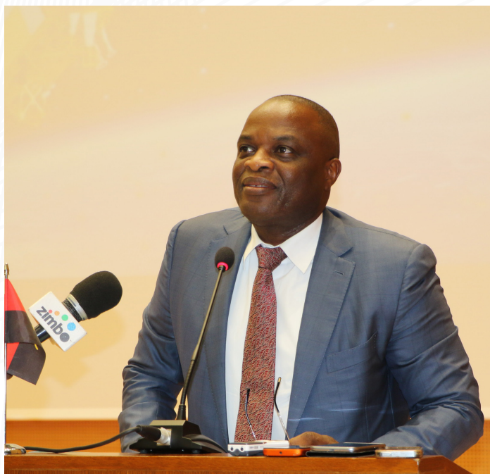
Ministro das Telecomunicações e Tecnologias de Informação Dr. José Carvalho da Rocha

O satélite apoiará na distribuição de serviços de telecomunicações como televisão, Internet e telefonia em todo território nacional, contribuindo para a inclusão digital e coesão nacional de todos os angolanos, bem como